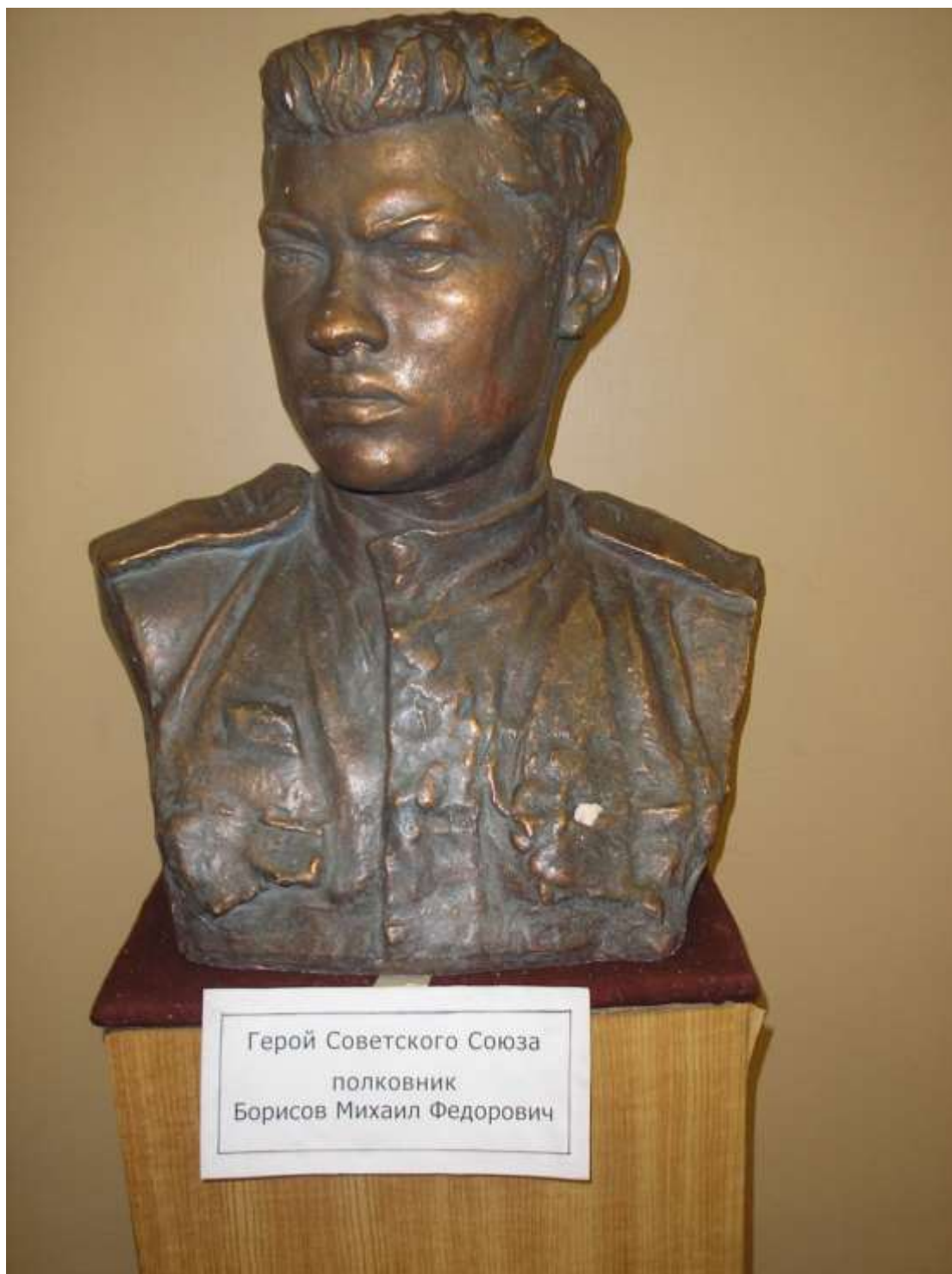
Бюст М.Ф.Борисова (музей Боевой Славы 8 гвардейского Краснознаменного танкового корпуса)